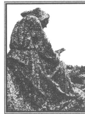
Commanderie des Antonins

La cérémonie des vœux aura lieu le 11 janvier 2015 à 15 h à la salle communale Venez nombreux.